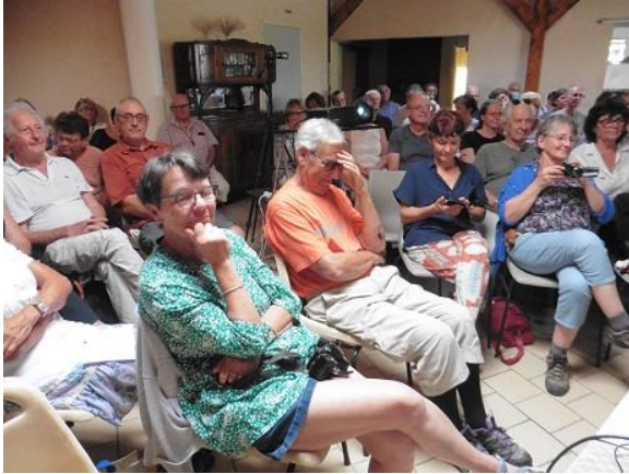
Le public dans le Café de la Marine