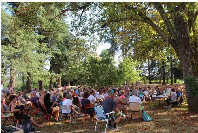
Table ronde dans le parc du château de Blagnac