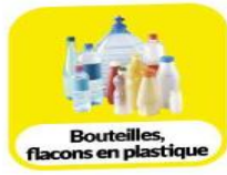
Bouteilles, flacons en plastique