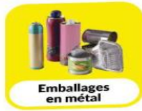
Emballages en métal