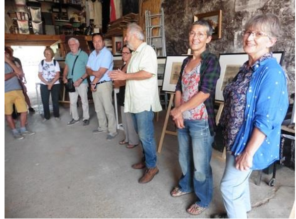
Présentation de l'exposition dans l'atelier Aracabara