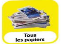
Tous les papiers