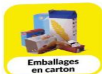
Emballages en carton