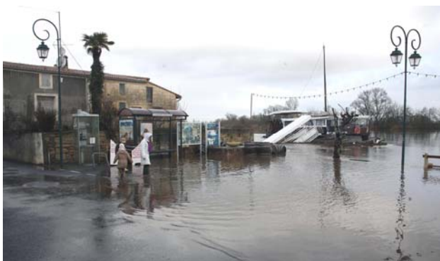
L'Avenue du Port a été partiellement inondée le lundi 26