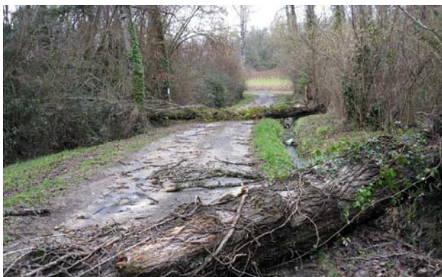
Plusieurs arbres se sont abattus sur le chemin des Olibats

Le Maire et son conseil adressent leurs sincères remerciements aux bénévoles qui ont participé aux travaux de dégagement des routes.