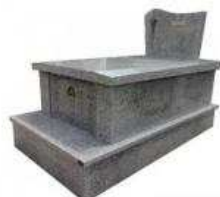
Concessions trentenaires ▪ 100 € le m 2