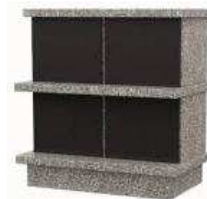
Columbarium 400 € pour 15 ans 700 € pour 30 ans

Afin de proposer aux défunts et à leur famille des conditions de sépultures décentes, une commission spécifique a été créée. Elle se réunit tous les samedis matin afin :