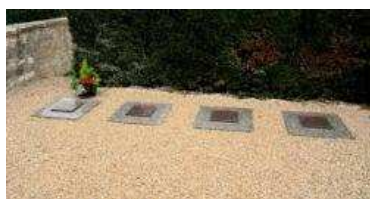
Exemples de cavurnes qui seront proposées prochainement