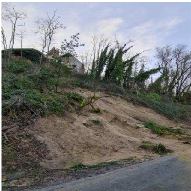
L'avenue du Port coupée par les coulées de boues

Le Centre Routier Départemental a demandé la fermeture d'une partie de l'avenue du Port qui longe la Dordogne, et ce jusqu'à nouvel ordre, en raison d'un risque important de nouvelle coulée. Un expert a été mandaté pour évaluer la situation et définir les éventuels travaux à engager afin de stabiliser le coteau.