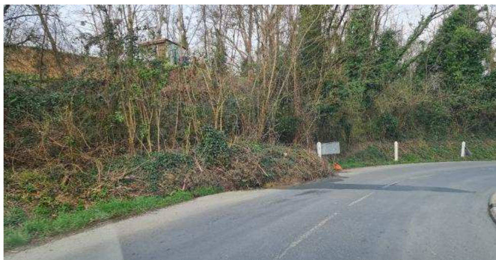
Coulée à Lacareau sur la RD18e