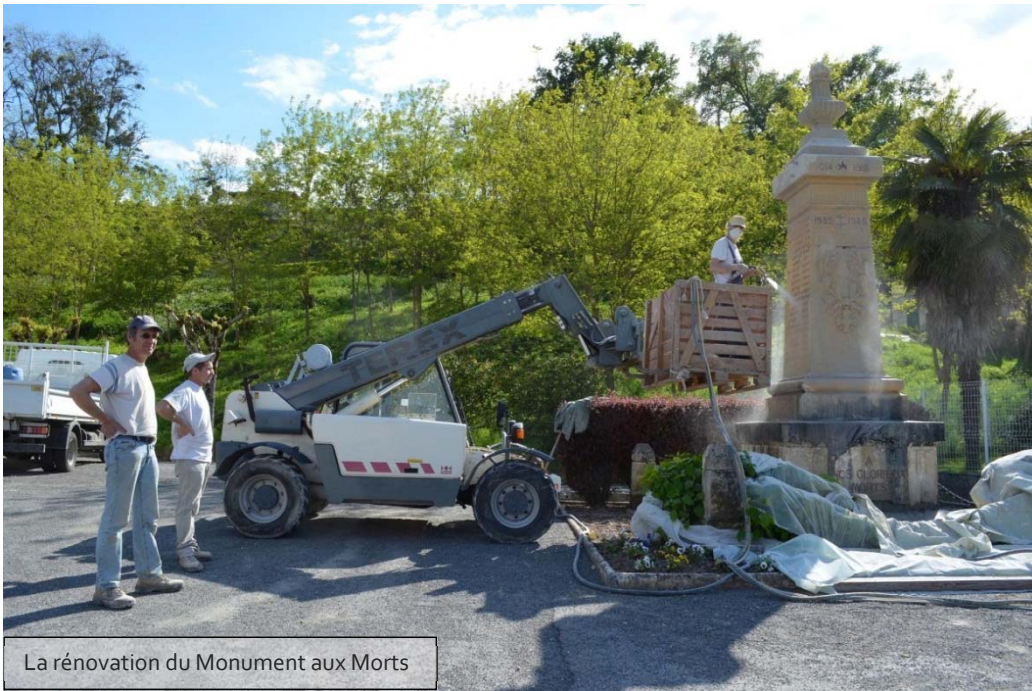
La rénovation du Monument aux Morts